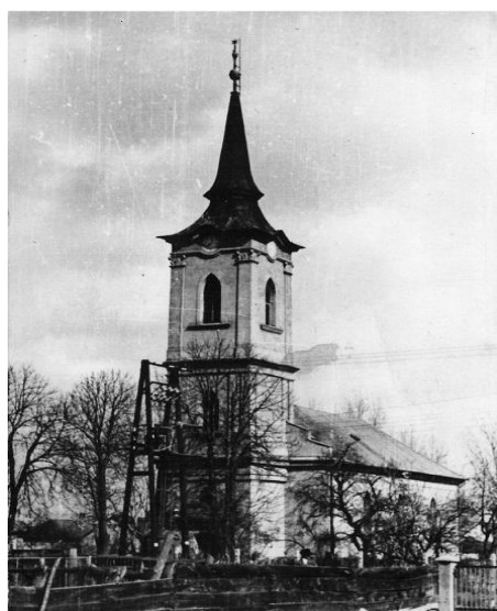
A református templom