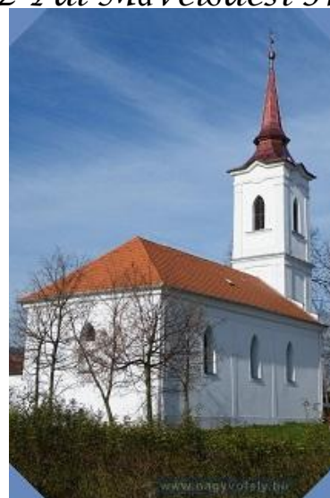
A református templom ma