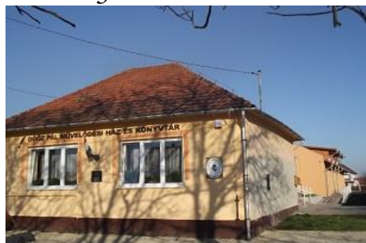
Göz Pál Művelődési Ház