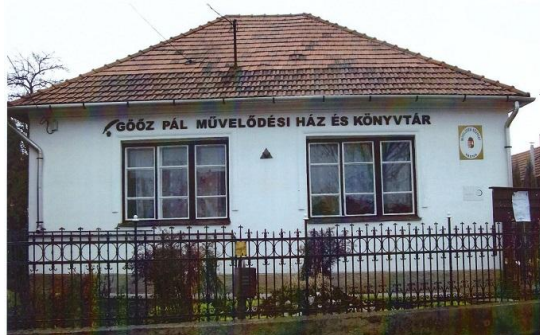
A Művelődési Ház